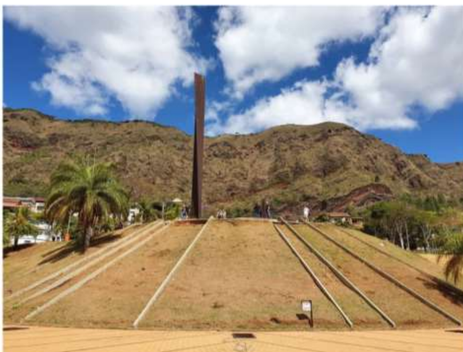
Praça do Papa

O #VEMPRABH é realizado pelo Turismo de Minas, tem o patrocínio da Prefeitura de Belo Horizonte, por meio da Belotur, e conta com os apoios das principais entidades do turismo: Federação Brasileira de Hospedagem e Alimentação (FBHA), Associação Brasileira da Indústria de Hotéis (ABIH/MG), Belo Horizonte Convention & Visitors Bureau (BHCVB), Associação Brasileira de Bares e Restaurantes (Abrasel/MG) e Sindicato das Empresas de Turismo de Minas Gerais (Sindetur/MG).