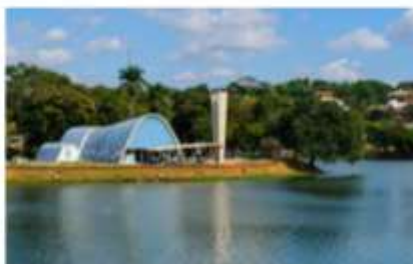
Igreja de São Francisco - Pampulha - Belo Horizonte