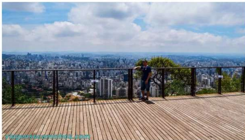
O que fazer em Belo Horizonte – Mirante das Mangabeiras