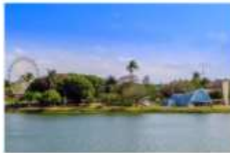
Igreja São Francisco de Assis, na lagoa da Pampulha

O #VEMPRABH é realizado pelo Turismo de Minas, tem o patrocínio da Prefeitura de Belo Horizonte, por meio da Belotur, e conta com os apoios das principais entidades do turismo: Federação Brasileira de Hospedagem e Alimentação (FBHA), Associação Brasileira da Indústria de Hotéis (ABIH/MG), Belo Horizonte Convention & Visitors Bureau (BHCVB), Associação Brasileira de Bares e Restaurantes (Abrasel/MG) e Sindicato das Empresas de Turismo de Minas Gerais (Sindetur/MG).