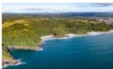
Prado com suas águas cristalinas

Prado com suas águas cristalinas e cenários exuberantes para tranquilizar a mente, apaziguar o coração e criar memórias inesquecíveis, Prado é o local ideal para curtir um o réveillon com calma. Lugar sossegado, com essência interiorana, a região é o verdadeiro Caribe Brasileiro, sendo inclusive um dos mais visitados do país. A natureza, em sua mais pura essência, cria uma atmosfera intimista e convidativa. A região também é famosa pela sua infraestrutura com belíssimos restaurantes e hotéis. A Pousada Casa de Maria, por exemplo, além da localização estratégica na cidade, é referência pela sua arquitetura rústica mesclada ao contemporânea, proporcionando ao turista uma hospedagem marcante. Outro ponto de destaque são as acomodações. Todas possuem ar-condicionado, Smart TV, frigobar livre, ventilador de teto, cofre digital e itens do banheiro como amenities, secador de cabelo e espelho de aumento flexível.