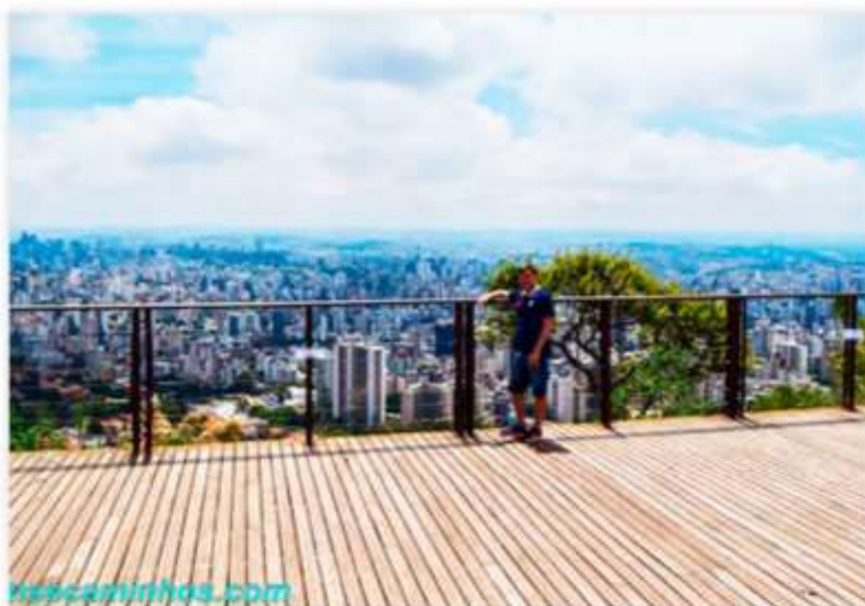
Mirante das Mangabeiras

como fazer os melhores registros desses locais. Encerraremos na Rua Sapucaí, polo da gastronomia e considerada o primeiro mirante de arte urbana do mundo", destaca Marden. Para os amantes da natureza, o projeto também conta com um roteiro de ecoturismo na Serra do Curral. "Faremos uma trilha de aproximadamente 2 km até o mirante para contemplar a esuberante vista da serra, lotar o olho da câmera com muitas fotos lindas e saber mais sobre a história da região".