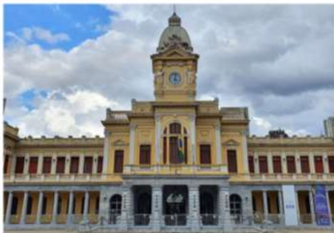
A região do centro de Belo Horizonte, por onde o roteiro #VEMPRABH passará

📌 Fique Atualizado ▶ #VEMPRABH realiza roteiros turísticos gratuitos por Belo Horizonte