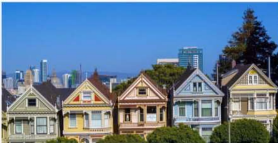
Na foto, a Hayes Street, em São Francisco, que ficou na 10ª posição.