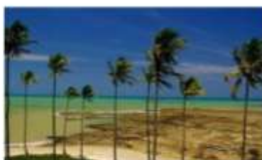
praias da Bahia

Ainda tem mais. A pousada oferece uma área de lazer completa, com direito a sauna, piscina, restaurante e bar, além de um espaço fitness. Detalhe: você pode aproveitar essa data especial com seu amiguinho de 4 patas, já que se trata de uma pousada Pet Friendly. A Pousada Casa de Maria ( www.pousadacasademaria.com.br ) preocupa-se com a sustentabilidade e adota processos e procedimentos ecológicos, fator que contribuiu com a sua conquista do selo Ecolideres.