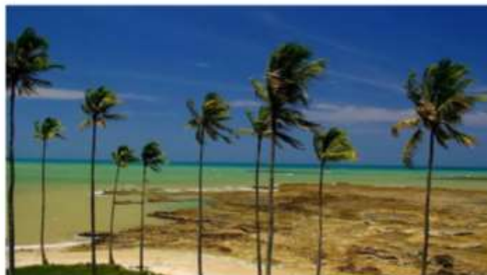
As praias da Bahia encantam os turistas

Prado com suas águas cristalinas e cenários exuberantes para tranquilizar a mente, apaziguar o coração e criar memórias inesquecíveis, Prado é o local ideal para curtir um o réveillon com calma. Lugar sossegado, com essência interiorana, a região é o verdadeiro Caribe Brasileiro, sendo inclusive um dos mais visitados do país. A natureza, em sua mais pura essência, cria uma atmosfera intimista e convidativa. A região também é famosa pela sua infraestrutura com belíssimos restaurantes e hotéis. A Pousada Casa de Maria, por exemplo, além da localização estratégica na cidade, é referência pela sua arquitetura rústica mesclada ao contemporânea, proporcionando ao turista uma hospedagem marcante. Outro ponto de destaque são as acomodações. Todas possuem ar-condicionado, Smart TV, frigobar livre, ventilador de teto, cofre digital e itens do banheiro como amenities, secador de cabelo e espelho de aumento flexível.