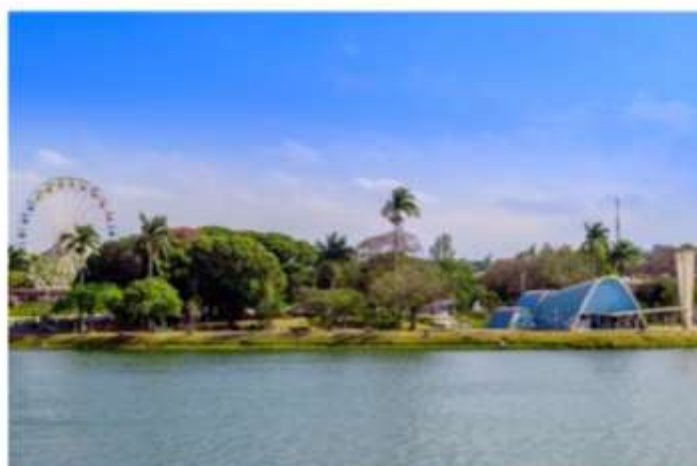
Igreja São Francisco de Assis, na lagoa da Pampulha

O #VEMPRABH já impactou mais de dois milhões de pessoas e os vídeos gravados, as fotos e os e-books turísticos de cada edição podem ser conferidos no site da campanha ( www.vemprabh.com.br ) e no canal de viagem do Turismo de Minas, no www.youtube.com/turismodeminas . "A cidade tem muita comida boa, inclusive tem o título de Cidade Criativa da Unesco pela Gastronomia, atrativos gratuitos e está sempre se reinventando e surpreendendo os visitantes. Queremos despertar o amor do belo-horizontino pela cidade, para que ele possa convidar seus amigos a desfrutarem dos inúmeros roteiros que temos aqui. É uma campanha para eles se apropriarem, participarem e indicarem", registra Luana Bastos, produtora do evento.