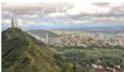
Serra do Curral - Belo Horizonte