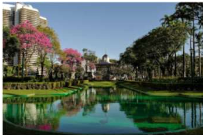
Praça da Liberdade

Com a proposta de divulgar e fomentar o turismo da capital mineira, o #VEMPRABH chega à sua 4ª edição e promove roteiros turísticos gratuitos para belo-horizontinos e turistas. A campanha acontece nos dias 10, 11, 17 e 18 de setembro, de 9h às 13h. O projeto promoverá quatro roteiros turísticos, que incluem um tour fotográfico pelo centro de BH, uma volta de ônibus retrô pela Lagoa da Pampulha, uma trilha contemplativa pela Serra do Curral e um roteiro pelos dois mercados mais queridos da cidade: o Mercado Central e o Mercado Novo.