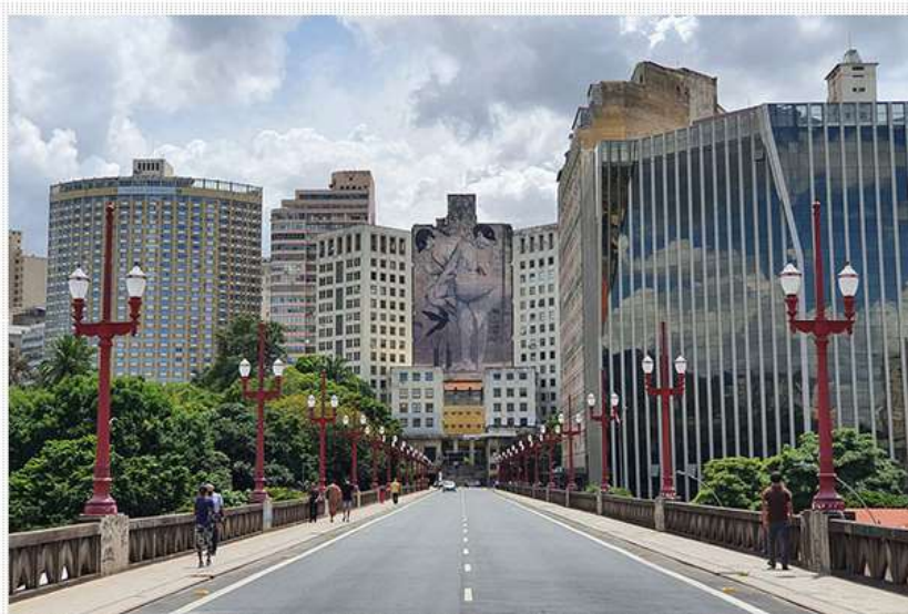
Um dos ângulos da capital mineira

ago 31, 2022 | editorial | Destaques, Destinos | 0