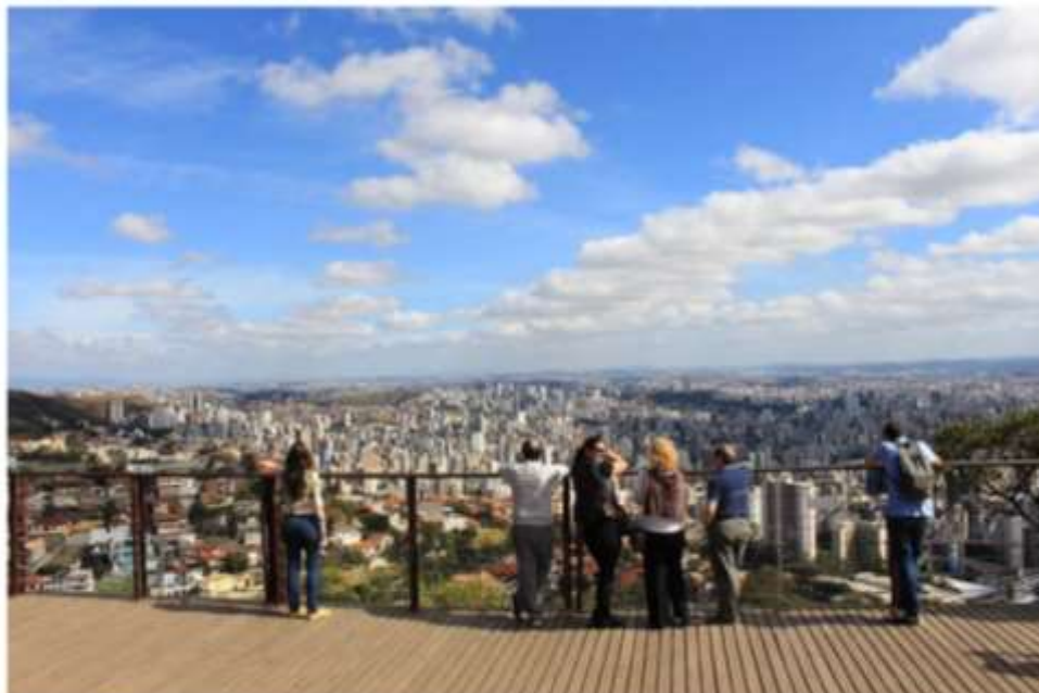
Mirante do Mangabeiras

Nos roteiros estão previstas visitas a algumas das lojas mais tradicionais do Mercado Central e do Mercado Novo, degustação e muita prosa. Outra experiência ímpar é o passeio de ônibus retrô aos principais pontos turísticos da Pampulha, como a Igrejinha e a Casa do Baile.