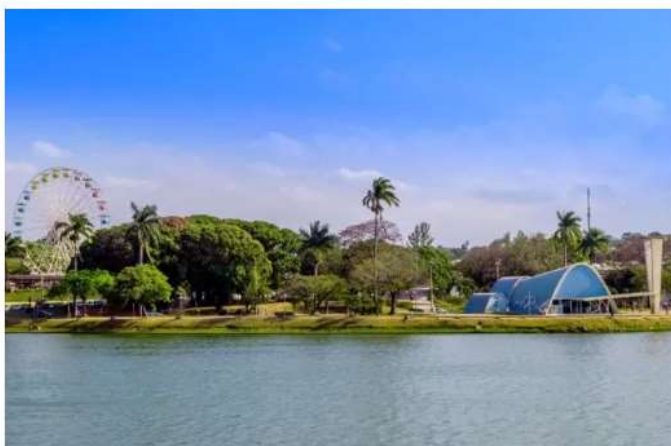
Igreja São Francisco de Assis, na lagoa da Pampulha

O #VEMPRABH já impactou mais de dois milhões de pessoas e os vídeos gravados, as fotos e os e-books turísticos de cada edição podem ser conferidos no site da campanha ( www.vemprabh.com.br ) e no canal de viagem do Turismo de Minas, no www.youtube.com/turismodeminas . "A cidade tem muita comida boa, inclusive tem o título de Cidade Criativa da Unesco pela Gastronomia, atrativos gratuitos e está sempre se reinventando e surpreendendo os visitantes. Queremos despertar o amor do belo-horizontino pela cidade, para que ele possa convidar seus amigos a desfrutarem dos inúmeros roteiros que temos aqui. É uma campanha para eles se apropriarem, participarem e indicarem!", registra Luana Bastos, produtora do evento.