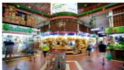
Mercado Central de BH

O projeto promoverá quatro roteiros turísticos, todos eles gratuitos