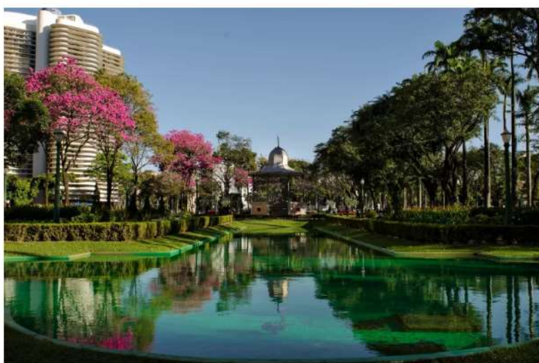
Praça da Liberdade

Com a proposta de divulgar e fomentar o turismo da capital mineira, o #VEMPRABH chega à sua 4ª edição e promove roteiros turísticos gratuitos para belo-horizontinos e turistas. A campanha acontece nos dias 10, 11, 17 e 18 de setembro, de 9h às 13h. O projeto promoverá quatro roteiros turísticos, que incluem um tour fotográfico pelo centro de BH, uma volta de ônibus retrô pela Lagoa da Pampulha, uma trilha contemplativa pela Serra do Curral e um roteiro pelos dois mercados mais queridos da cidade: o Mercado Central e o Mercado Novo.