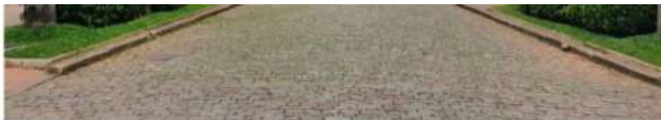
Praça da Liberdade

O #VEMPARABH já impactou mais de dois milhões de pessoas e os vídeos gravados, as fotos e os e-books turísticos de cada edição podem ser conferidos no site da campanha e no canal de viagem do Turismo de Minas, no YouTube .