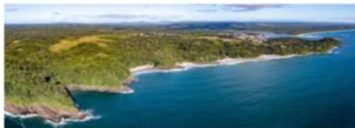
Turismo com a natureza encantando

Prado com suas águas cristalinas e cenários exuberantes para tranquilizar a mente, apaziguar o coração e criar memórias inesquecíveis, Prado é o local ideal para curtir um o réveillon com calma. Lugar sossegado, com essência interiorana, a região é o verdadeiro Caribe Brasileiro, sendo inclusive um dos mais visitados do país. A natureza, em sua mais pura essência, cria uma atmosfera intimista e convidativa. A região também é famosa pela sua infraestrutura com belíssimos restaurantes e hotéis. A Pousada Casa de Maria, por exemplo, além da localização estratégica na cidade, é referência pela sua arquitetura rústica mesclada ao contemporânea, proporcionando ao turista uma hospedagem marcante. Outro ponto de destaque são as acomodações. Todas possuem ar-condicionado, Smart TV, frigobar livre, ventilador de teto, cofre digital e itens do banheiro como amenities, secador de cabelo e espelho de aumento flexível.