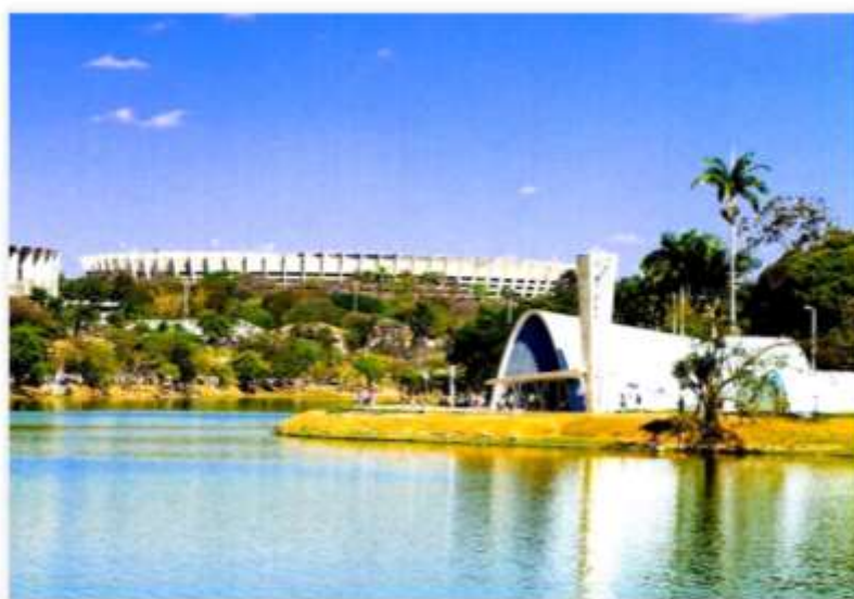
Igreja São Francisco de Assis, no lago da Pampulha e Mineirinho