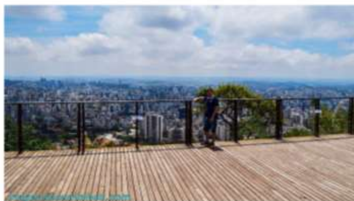
Mirante das Mangabeiras

O #VEMPRABH já impactou mais de dois milhões de pessoas e os vídeos gravados, as fotos e os e-books turísticos de cada edição podem ser conferidos no site da campanha ( www.vemprabh.com.br ) e no canal de viagem do Turismo de Minas, no www.youtube.com/turismodeminas . "A cidade tem muita comida boa, inclusive tem o título de Cidade Criativa da Unesco pela Gastronomia, atrativos gratuitos e está sempre se reinventando e surpreendendo os visitantes. Queremos despertar o amor do belo-horizontino pela cidade, para que ele possa convidar seus amigos a desfrutarem dos inúmeros roteiros que temos aqui. É uma campanha para eles se apropriarem, participarem e indicarem", registra Luana Bastos, produtora do evento.