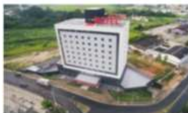
grupo Summit Hotels

O grupo Summit Hotels nasceu em outubro de 2018 atuando com os modelos de arrendamento, administração e franquia hoteleiras. Ao longo desses anos, passou a cuidar de diversos empreendimentos nos estados de São Paulo, Minas Gerais, Rio de Janeiro e Alagoas, sempre com qualidade e excelência, focando no bem-estar dos hóspedes.