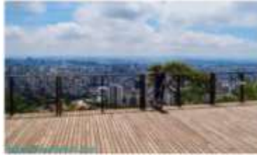
Mirante das Mangabeiras

O #VEMPRABH já impactou mais de dois milhões de pessoas e os vídeos gravados, as fotos e os e-books turísticos de cada edição podem ser conferidos no site da campanha ( www.vemprabh.com.br ) e no canal de viagem do Turismo de Minas, no www.youtube.com/turismodeminas . “A cidade tem muita comida boa, inclusive tem o título de Cidade Criativa da Unesco pela Gastronomia, atrativos gratuitos e está sempre se reinventando e surpreendendo os visitantes. Queremos despertar o amor do belo-horizontino pela cidade, para que ele possa convidar seus amigos a desfrutarem dos inúmeros roteiros que temos aqui. É uma campanha para eles se apropriarem, participarem e indicarem!”, registra Luana Bastos, produtora do evento.